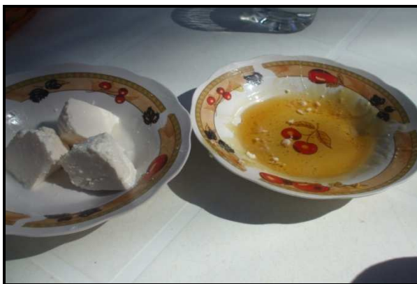
Figure 2. Le miel et fromage de chèvre se mangent souvent couplés à Béni Khédache