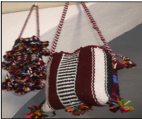
Figure 5. Sac fait en laine produite localement