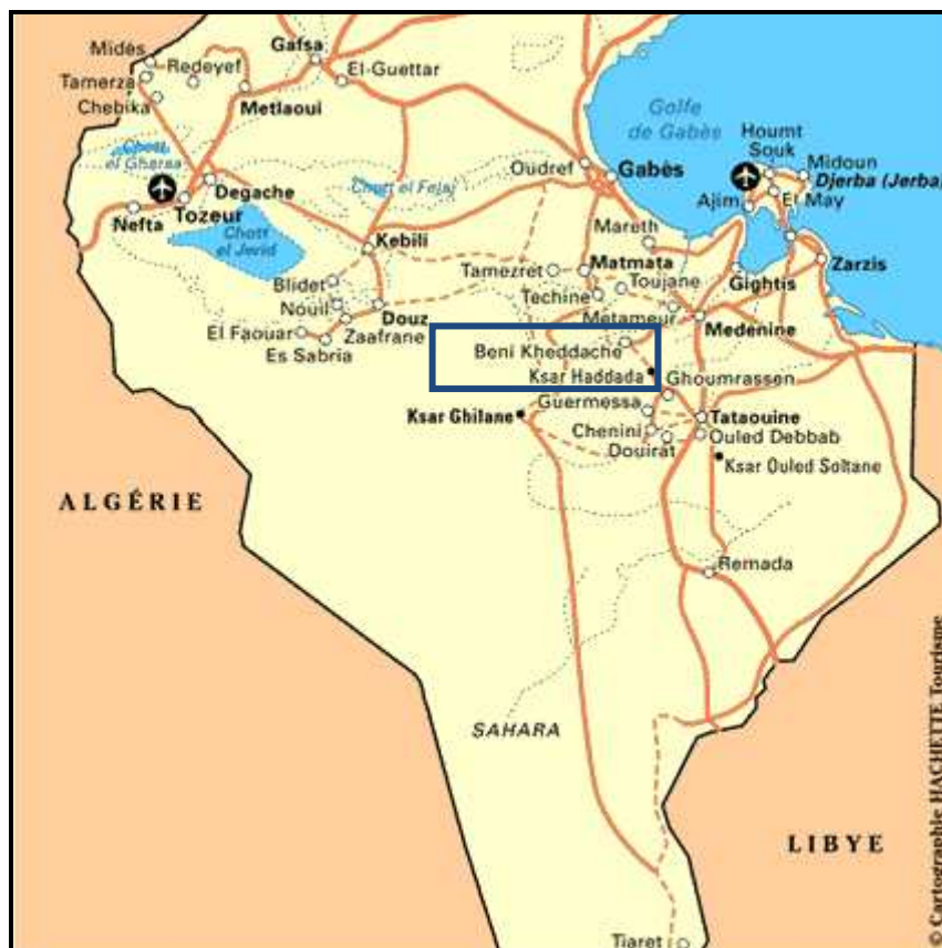
Figure 1. Béni Khédache au sud-est de la Tunisie

La délégation de Béni Khédache appartient au gouvernorat 3 de Médenine situé dans le sud-est du pays (figure 1). Elle couvre une superficie de 1356 Km 2 et compte 28600 habitants en 2004. Son climat est semi-aride et marqué par sa variabilité. En effet, cette région est soumise à la fois aux influences provenant de la zone côtière ainsi qu'aux influences du désert. A cela s'ajoutent les influences du relief sur les différents paramètres climatiques notamment la température, la pluie et le vent. La région est soumise à deux régimes de vents dominants ; les vents de secteur Nord-Nord est à Est, en provenance de la côte et les vents de secteur Sud-Sud ouest à Ouest, en provenance du désert. La variabilité du climat se manifeste à travers le régime pluviométrique caractérisé par des précipitations faibles et irrégulières, parfois torrentielles. De sa part, Le régime thermique est caractérisé par des températures élevées durant l'été, et des températures relativement fraîches durant l'hiver.