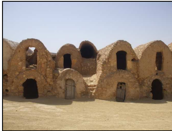
Figure 4. Ksar Hallouf à Béni Khédache

Les ksour est une vraie richesse patrimoniale construite sur des sites dominants qui offrent des paysages inoubliables. Du haut de ces sites on pourrait découvrir des points de vue saisissants, où l'aridité des versants montagneux contraste avec les vallées souvent verdoyantes grâce au rôle important des jessour 6 .